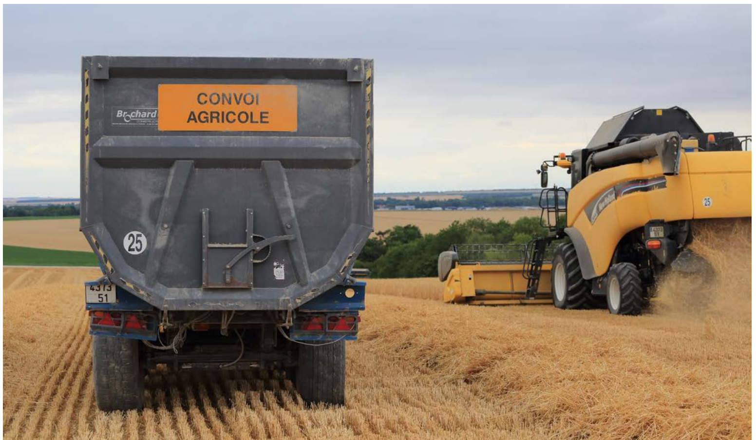
La vitesse maximale des véhicules agricoles va être déterminée par leur homologation (25 ou 40 km/h).

Pour les véhicules agricoles (ou ensembles), le Code de la route a créé des règles spécifiques. On distingue, ainsi, les groupes A et